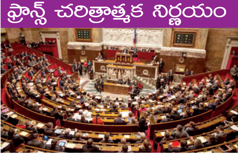
ఫ్రాన్స్ చరిత్రాత్మక నిర్ణయం మిమ్మల్ని నిర్ణయించలేరు అని ఓటింగ్కు ముందు ఫ్రాన్స్ ప్రధాని గాబ్రియేల్ ఆట్టల్ అన్నారు. అబార్షన్ హక్కు కోసం 1974 నుంచి ఫ్రాన్స్లో మహిళలు పోరాడుతున్నారు. కానీ, దీనిపై పెద్దఎత్తున విమర్శలు వచ్చాయి. కానీ,

పారిస్, మార్చి 5: అబార్షన్లను మహిళల రాజ్యాంగ హక్కుగా నిర్ణయిస్తూ తీసుకోవాలని చరిత్రాత్మక బిల్లును ఫ్రాన్స్ పార్లమెంట్ ఆమోదించింది. ఉభయసభల సంయుక్త సమావేశంలో ఈ బిల్లుకు ఆమోదం లభించింది. బిల్లుకు మద్దతుగా 780 ఓట్లు రాగా వ్యతిరేకంగా 72 ఓట్లు వచ్చాయి. ఆమోదం అనంతరం సభ్యులంతా లేచి నిలబడి కరతాళ ధ్వజాలతో సంతోషావం తెలిపారు. దీంతో ప్రపంచంలో అబార్షన్లను రాజ్యాంగ హక్కుగా గుర్తించిన మొదటి దేశంగా చరిత్ర సృష్టించింది. పలు వర్గాల నుంచి వ్యతిరేకించినా ఇమ్మ్యూన్యూయేట్ మోక్షాన్ వెనక్కి తగ్గలేదు. బిల్లు ఆమోదం పొందడంతో ఫ్రాన్స్ అంతటా సుఖసంతోషం జరిగింది. పారిస్ వీధుల్లో ఈఫిల్ టవర్ వద్ద సామాజిక కార్యకర్తలు 'మైబాడీ మైబాయిస్' అనే నినాదాలూ రాసి ఉంచిన ప్లాకార్డులను ప్రదర్శించారు. అబార్షన్ హక్కులను ఫ్రాన్స్ వ్యాప్తంగా పెద్ద ఎత్తున మద్దతు లభించింది. చట్టబద్ధత కోసం నిర్దేశించిన ఓటింగ్లో 80 శాతం మంది మద్దతు తెలిపారు. మేము మహిళలందరికీ సందేశం వంపాం.. మీ శరీరం మీదే.. ఎవరూ