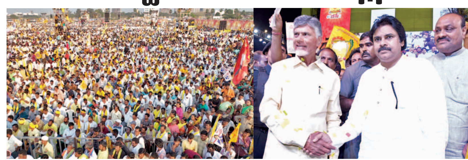
మంగళవారం ఆచార్య నాగార్జున యూనివర్సిటీలో జరిగిన 'జయహో బసె' సదస్సులో పాల్గొన్న చంద్రబాబునాయుడు, పవన్ కల్యాణ్, హోదైన ప్రజానికం

50యేళ్లు నిండిన వారికి నెలకు రూ.4వేల పెన్షన్ 'సబ్ ప్లాన్' ద్వారా ఐదేళ్లలో రూ.1.50లక్షల కోట్లు ఖర్చు బీసీలులేకుంటే సమాజం ముందుకెళ్లదు-నాగరిక తతు మూలం బీసీలే బీసీలను పల్లకి మోసే బోయీలుగా చూస్తున్న జగన్ 'జయహో బీసీ' సదస్సులో చంద్రబాబునాయుడు జనసేన అధినేత పవన్ తో కలిసి 10 అంశాలతో బీసీ డిక్లరేషన్ ప్రకటన