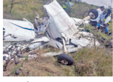
గాల్లో ఢీ కొన్న రెండు విమానాలు ఇద్దరు మృతి కెన్యా, మార్చి 5: రెండు విమానాలు గాల్లో ఢీకొన్న ఫలితంగా ఇద్దరు మృతి చెందారు. కెన్యాలోని నైరోబీ జాతీయ పార్కు గగనతలంలో ఈ ప్రమాదం చోటు చేసుకుంది. పోలీసుల వివరాల ప్రకారం సెఫారిలింట్ ఏవియేషన్కు చెందిన ఫైట్లో ఐదుగురు సిబ్బంది సహా 44 మందిలో మంగళవారం ఉదయం నైరోబీలోని విల్సన్ ఎయిర్పోర్టు నుంచి బోకాకో తీసుకుంది. అప్పటికే అక్కడి నుంచి బయల్దేరిన ఓ చిన్నపాటి శిక్షణ విమానం గాల్లో చక్కర్లు కొడుతుంది. ఈ క్రమంలో నైరోబీ జాతీయ పార్కు గగనతలంలో ఉన్న శిక్షణ విమానాన్ని మరోకటి చచ్చి ఢీ కొన్నట్లు పోలీసులు తెలిపారు. దీంతో చిన్న విమానం నేల కులాలు. యువోని ఇద్దరు ఫైలర్లు మృతిచెందినట్లు చెప్పారు. బోకాకో అయిన కొద్ది సేపటికే భారీ శబ్దం వినిపించింది. దీంతో సిబ్బంది వెంటనే ప్లైబిస్ వెనక్కి మళ్లించింది. సురక్షితంగా ల్యాండ్ చేశారు. ఎలాంటి ప్రాణ నష్టం జరగలేదు అని సెఫారిలింట్ తెలిపింది. ఈ ఘటనపై విచారణ జరుపుతున్నట్లు అధికారులు వెల్లడించారు.

ఇస్లామాబాద్, మార్చి 5: పాకిస్తాన్లో ఇటీవల కురిసిన మంచువాన దజన్ల సంఖ్యలో ప్రజల ప్రాణాలును బలిగొన్నాయి. ఈ ఘటనలో మృతులు సంఖ్య 36కి చేరింది. మరో 43 మంది గాయపడ్డారని డాన్ పత్రికే పేర్కొంది. మృతుల్లో 22 మంది వరకు చిన్నారని తెలుస్తోంది. చాలా మంది మంచు పెళ్ల కింద చిక్కుకుపోయి చని పోయినట్లు అధికారులు చెబుతున్నారు. సాధారణంగా మార్చిలో పాక్ మార్చిలో పాక్ పశ్చిమ, ఉత్తర భాగాల్లో వేడి ఉత్పాక అధికంగా ఉంటుంది. వర్షావరణ మార్పుల్లో భాగంగానే ఇలా జరిగినట్లు వాతావరణ శాఖ మాజీ డైరెక్టర్ జనరల్ ముస్తాఫ్ అలీషా వెల్లడించారు. కొన్ని క్షణాలపాటు వడగళ్ల వాన వడటం, సాధారణమే. కానీ, ఈసారి 30 నిమిషాల పాటు అది న్నారు. బజార్, విమానశండ్, స్కాల్, ఫైబర్, సెషె వర్, లక్ష్మీ మర్కాట్, చిల్కాల్, మర్కాన్ ప్రాంతాల్లో దీని తీవ్రత నమోదైంది. బజార్లో