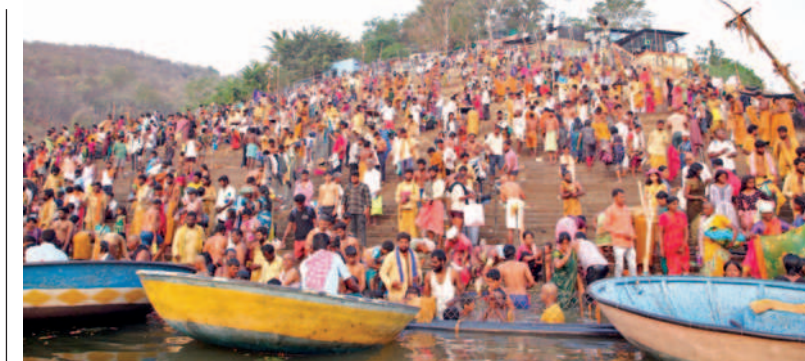
పాతాళగంగ వద్ద కిక్కిరిసిన భక్తులు

అమరావతి, మార్చి 5, ప్రభాతవార్త ప్రతినది: నామీ నేషనల్ పొందుపరిచేందుకు తనన్ను నమోదైన కేసుల వివరాలు ఇవ్వాలని టీడిపి అధ్యక్షుడు చంద్రబాబునాయుడు రాష్ట్ర డిజిపికి లేఖ రాశారు. 2019 తర్వాత వివిధ జిల్లాల్లో తనన్ను పోలీసులు పెట్టిన కేసుల వివరాలు తెలియపాలని చంద్రబాబు పేర్కొన్నారు. లేఖలో అంశాలు ఇలా ఉన్నాయి: కేంద్ర ఎన్నికల సంఘం నిబంధన ప్రకారం, ఎన్నికల్లో పోటీచేసే ప్రతి అభ్యర్థి తమపై నమోదైన కేసుల వివరాలు నామినేషన్ సమయంలో అధికారులకు తెలియజేయాలి కంటి ఉండాలి. గత 5 ఏళ్ల కాలంలో ప్రజా సమస్యలపై పోరాడుతున్న నాపై పలు అక్రమ కేసులు బనాయించారని పేర్కొన్నారు. ప్రభుత్వ విధానాలపై పోరాడుతున్న కారణంగా నాపై స్వేచ్ఛలో, వివిధ ఏజెన్సీల ద్వారా కేసులు పెట్టారని తెలిపారు. ఇలాంటి సందర్భాల సందర్భంలో ఏజెన్సీలు, అధికారులు నాపై పెట్టిన కేసుల విషయంలో నాకు సమాచారం ఇవ్వలేదని బాబు పేర్కొన్నారు. ఎమ్మెల్యేగా, ప్రతిపక్ష నేతగా పనిచేస్తున్న నాపై 2019 నుంచి నమోదైన కేసుల వివరాలు తెలియజేయాలని కోరుతు