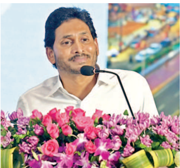
మంగళవారం విశాఖలో 'విజన్ విశాఖ' సదస్సులో మాట్లాడుతున్న సి.ఎం జగన్

విశాఖపట్నం, మార్చి 5, ప్రభాతవార్త ప్రతినది: విశాఖ రాజధానిని సీఎం జగన్మోహన్ రెడ్డి మరోసారి కీలక వ్యాఖ్యలు చేశారు. సార్వత్రిక ఎన్నికల అనంతరం విశాఖలోనే ప్రమాణ స్వీకారం చేసి, ఇక్కడి నుంచే పాలన సాగిస్తానని ప్రకటించారు. ఎన్నికలలో ప్రజల ఆశీస్సులతో మళ్లీ గెలిచి విశాఖ నుంచే పరిపాలన కొనసాగిస్తానన్నారు. విశాఖ అభివృద్ధికి కట్టుబడి ఉన్నానని, అమరావతిని శాసన రాజధానిగా, విశాఖను పాలన రాజధానిగా కొనసాగిస్తానన్నారు. విశాఖ చాలా అభివృద్ధి చెందాల్సి ఉందన్నారు. ఈ సగరాన్ని అన్ని సౌకర్యాలతో అభివృద్ధి చేస్తామని ఆయన చెప్పారు. తాను అమరావతి రాజధానిని, అభివృద్ధికి వ్యతిరేకం కాదని ఆయన స్పష్టంచేశారు. మంగళవారం విజన్ విశాఖ పేరిట పారిశ్రామికవేత్తలతో ఒక హాట్ టాలో నిర్వహించిన సదస్సులో ఆయన ప్రసంగించారు. ఈ సందర్భంగా ఆయన విశాఖలో పనిచేసే పారిశ్రామికవేత్తలకు వివ