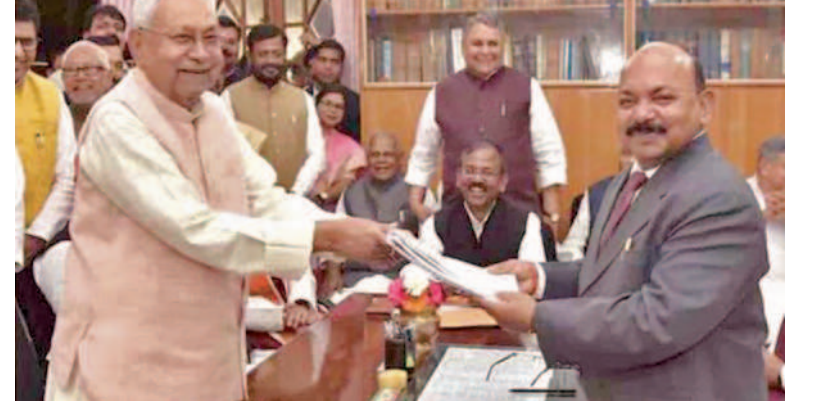
సంహారణకు వివరాలేదీ మార్చి 14 మార్చి 21వ తేదీన ఉదయం నుంచి 9నంబి సాయంత్రం 4గం.వకు ఓటింగ్ జరగనుంది. అదే రోజు ఫలితాలు వెల్లడిస్తారు.