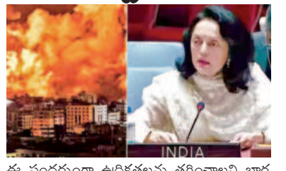
ఈ సందర్భంగా ఉద్దేశాలను తగ్గించాలని భారత్ శాశ్వత రాయబారి అభ్యర్థించారు. శాశ్వత పరిష్కారం చేసుకునేందుకు హిందూ మనకో వాలని, బంధించరని విషయాల చేయాలని కోరారు. రెచ్చగొట్టే చర్యలను నివారించాలి, ప్రత్యక్ష శాంతి చర్యలను త్వరగా పునఃప్రారంభించాలి కృషి చేయాలని ప్రతి ఒక్కరినీ కోరుతున్నామని రుచిరా కాంబోజ్ అన్నారు. అంతేకాదు ఈ ఘర్షణలో పౌరులు మరణించిన వారిని తాము తీవ్రంగా ఖండిస్తున్నట్లు చెప్పారు. హిందూ, శతృత్వం మరింత పెరగకుండా నిరోధించడం చాలా ముఖ్యమని ఈ సందర్భంగా అన్నారు. ఎలాంటి ఘర్షణ జరిగినా సామాన్యుల ప్రాణాలను కాపాడటం ప్రధానమని గుర్తు చేశారు. గాజాలో ఇజ్రాయెల్, హమాస్ మధ్య దాగదావు ఐదు నెలలుగా వివాదం కొనసాగుతోంది. గత అక్టోబరు 7న దక్షిణ ఇజ్రాయెల్లో హమాస్ దాడి తర్వాత మొదలైన యుద్ధంలో 30 వేల మందికిపైగా ప్రాణాలు కోల్పోయారు.

జెరూసలేం, మార్చి 5: గాజాలో ఇజ్రాయెల్, హమాస్ మధ్య దాగదావు ఐదు నెలలుగా వివాదం కొనసాగుతోంది. ఈ నేపథ్యంలో భారత్ కీలక నిర్ణయం తీసుకుంది. ఈ రెండు ప్రాంతాల పరిష్కారానికి తమ మద్దతు ఇస్తామని భారత్ వెల్లడించింది. ఐదు నెలలుగా కొనసాగుతున్న యుద్ధాన్ని ఆపేయడం అనేక దేశాలు ప్రయత్నిస్తున్నాయి. ఆంధ్రకాం కొత్త ప్రతిపాదనలు తీసుకోవ్వచ్చున్నాయి. అయితే పరిస్థితి మాత్రం ఇంకా మెరుగుపడలేదు. ఈ క్రమంలోనే భారత్ తదేకం కీలక నిర్ణయం తీసుకుంది. ఈ రెండు ప్రాంతాల పరిష్కారానికి మద్దతు ఇవ్వడానికి భారత్ కట్టుబడి ఉందని బరాన్ (యుఎన్.ఎల్.ఎ) భారత్ శాశ్వత ప్రతినిధి రుచిరా కాంబోజ్ పేర్కొన్నారు. వీటో వినియోగంపై సోమవారం జరిగిన ఇత్యరాజ్య సమితి జనరల్ అసెంబ్లీ సమావేశంలో కాంబోజ్ ఈ మేరకు వెల్లడించారు. ఈ వివాదంపై భారత్ దేశం వైఖరి స్పష్టంగా ఉందని చెప్పారు. రెండు వక్షాల మధ్య ప్రత్యక్ష అభివేతమైన చర్చల ద్వారా మాత్రమే శాశ్వత శాంతి లభిస్తుందని ఆమె అన్నారు. ఇజ్రాయెల్ భద్రతా అవసరాలను గౌరవించి సురక్షితమైన సరిహద్దులతో స్వతంత్ర దేశాల పాలనా ప్రజలు స్వేచ్ఛగా జీవించగలిగే రెండు రాష్ట్రాల పరిష్కారానికి మద్దతు ఇవ్వడానికి భారత్ దేశం కట్టుబడి ఉందని వెల్లడించారు.