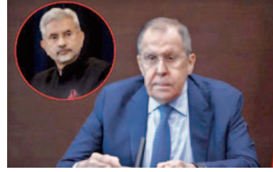
ఆయన్ను ప్రశ్నించారు. 'మీ పని మీరు మానుకోండి' అంటూ అక్కడనున్న వారికి జైతరం సూచించారు. ఇక అప్పటి నుంచి పాశ్చాత్య దేశాలు రష్యాపై చమురు కొనుగోలును ప్రారంభించాయి. ఇది జాతీయ గౌరవం కాదు లావోవ్ గుర్తుచేసుకున్నారు. మాస్కో దండయాత్ర కారణంగా తర్రెన్ ప్రశ్నలకు రాజకీయ ఉద్దేశాలతో భారత్ చమురు దిగుమతి చేసుకోవడం రష్యాకు అనుకూలం అంటే.. 2022-2023 మధ్య రోజుకు 1.27 మిలియన్ బ్యారెళ్ల చమురు దిగుమతులు జరిగాయి. భారత్కు చమురు దిగుమతి రద్దీని నిలిపివేసారు. భారత్కు చమురు దిగుమతి రద్దీని నిలిపివేసారు. భారత్కు చమురు దిగుమతి రద్దీని నిలిపివేసారు.

మోస్కో, మార్చి 5: భారత్ ఎప్పటికీ తమ విరళ మిత్రదేశమేనని రష్యా మరోసారి ప్రకటించింది. ఉక్రెయిన్లో యుద్ధం నేపథ్యంలో రష్యా చమురు కొనుగోలు అంతం చేయాలనే నేతల నుంచి వచ్చిన విమర్శలను భారత్ తిప్పికొట్టిన తీరును గుర్తుచేసింది. రష్యా విదేశాంగ మంత్రి సెర్గీ లావోవ్ భారత్ సమర్థతను ప్రశంసించారు. సోచిలో జరిగిన వరల్డ్ యూత్ ఫోరమ్లో ఆయన పాల్గొన్నారు. ఈ సందర్భంగా ఆడిగిన ప్రశ్నలకు లావోవ్ బదులిచ్చారు. రెండేళ్లుగా ఉక్రెయిన్పై రష్యా యుద్ధం సాగిస్తోంది. ఈ నేపథ్యంలో నాడు యూరోప్ దేశాలు రష్యాపై పలు అంక్షలు విధించాయి. ఏ దేశం కూడా రష్యా నుంచి చమురు కొనుగోలు చేయకూడదంటూ ప్రకటించాయి. అయినప్పటికీ రష్యాలో భారత్ చమురు కొనుగోళ్లను కొనసాగించింది. ఈ ఆంక్షలపై తర్రెన్ ప్రశ్నలకు లావోవ్ స్పందించారు. 'యుద్ధసమయంలో ఇత్యరాజ్యసమితిలో జరిగిన సమావేశంలో నా స్పృహకు, భారత్ విదేశాంగ మంత్రి సుబ్రమణ్యం శైకరకర్ ప్రసంగించారు. రష్యా నుంచి చమురు కొనుగోళ్లను ఎందుకు ప్రారంభించారని వచ్చిన దేశ నేతలంతా