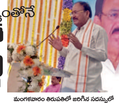
మంగళవారం తిరుపతిలో జరిగిన సదస్సులో మాట్లాడుతున్న వెంకయ్యనాయుడు

రాజకీయాల్లోనూ మహిళలు రాణించాలి మాజీ ఉపరాష్ట్రపతి వెంకయ్యనాయుడు తిరుపతి, మార్చి 5 ప్రభాతవార్త ప్రతినది: భారత ప్రభుత్వం స్వయం ఉపాధికోసం అందిస్తున్న రుణాల్లో 70 శాతం మహిళలే పొందుతున్నప్పటికీ, మహిళల భాగస్వామ్యం పెరగకపోవడం పట్ల ఆలోచన చేయాలని మాజీ ఉపరాష్ట్రపతి ఎం.వెంకయ్యనాయుడు అన్నారు. ఆత్మనిర్భర భారత నిర్మాణంలో అన్ని వర్గాలు తమదైన పాత్ర పోషిస్తున్నా మహిళల భాగస్వామ్యం లేకుండా మరింత పురోభివృద్ధి సాధ్యం కాదని స్పష్టం చేశారు. ఈ విషయంలో మహిళా బిల్లు ఆమోదం వంటి చోరవతో భారత ప్రభుత్వం ముందుకు వచ్చిందన్నారు. మహిళలు రాజకీయాల్లోనూ రాణించాలని, సమాజం మరింత ముందుకు రావాలని ఆయనకు ఉంది ఆయన సూచించారు. రాష్ట్రీయ సేవాసమితి (రాసీ) ఆధ్వర్యంలో తిరుపతిలోని ఒకలోలో అంతర్జాతీయ మహిళా డిలోక్షన్ వేడుకలను నిర్వహించారు. ఈ కార్యక్రమంలో ముఖ్యఅతిథిగా విచ్చేసిన మాజీ ఉపరాష్ట్రపతి వెంకయ్యనాయుడు మాట్లాడుతూ మహిళలు విద్య, ఉద్యోగపరంగానేగత స్వయం ఉపాధి దిశగా ముందుకు నడుస్తున్నారన్నారు. ఆచార్య ఎన్టీఆర్ గాంచింపిన స్ఫూర్తితో 1981లో గాంధీయవాది పి.రాజగోపాలాచార్యుడు నేతృత్వంలో స్థాపితమైన రాసీ సంస్థ సర్వోదయ నాయకురాలు డాక్టర్ నిర్మలా దేవ్ పాండే ఆధ్వర్యంలో గుత్తా ముని రత్నంనాయుడు చేతులమీదుగా రాసీ ముందుకు సాగిన తీరును ఆయన గుర్తు చేశారు. గ్రామీణాభివృద్ధితోపాటు పట్టణ పేదల సమస్యలకు పరిష్కారం అందించేందుకు